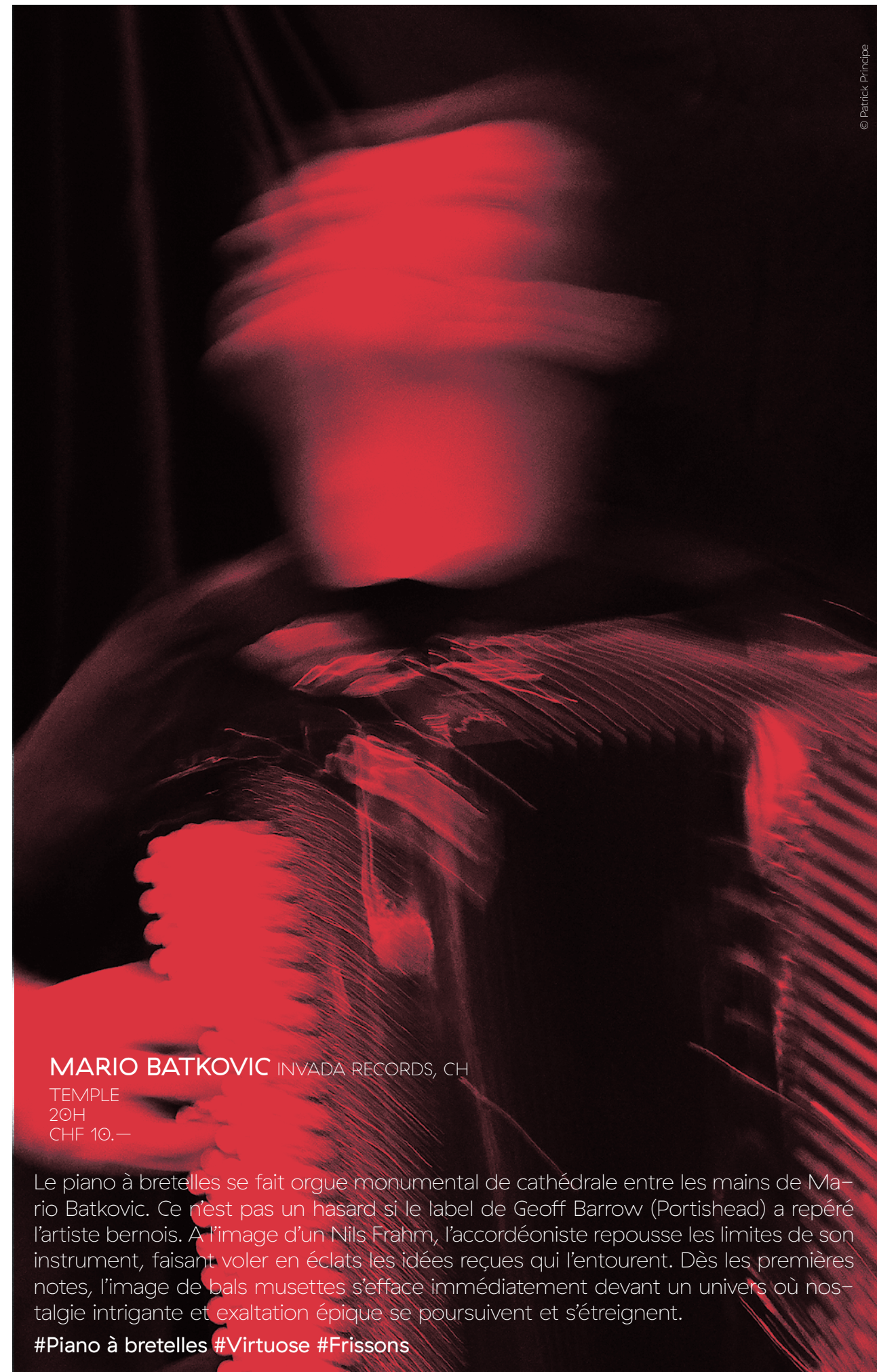
MARIO BATKOVIC INVADA RECORDS, CH TEMPLE 20H CHF 10.—

#Avec ou sans alcool #L'écume des jours #Santé!