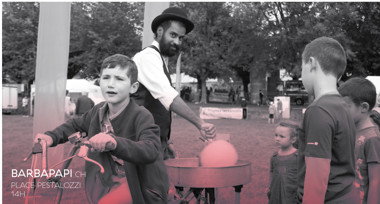
BARBAPAPI CH PLACE PESTALOZZI 14H

On dit que le voyage en lui-même est parfois plus important que la destination. Mais est-ce bien sérieux de dire cela quand le but final prend la forme d'une barbapapa? Gerry Oulevay invite les becs à bonbons, petits et grands, à pédaler pour une épopée aussi poétique que gourmande. Si le vélo ne se déplace pas, mirettes et papilles voyagent assurément.