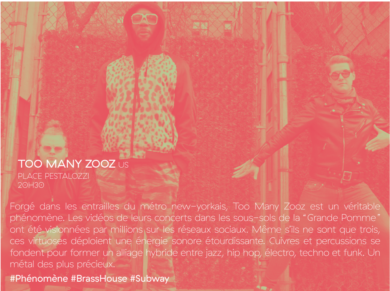
TOO MANY ZOOZ US PLACE PESTALOZZI 20H30

Forgé dans les entrailles du métro new-yorkais, Too Many Zooz est un véritable phénomène. Les vidéos de leurs concerts dans les sous-sols de la “Grande Pomme” ont été visionnées par millions sur les réseaux sociaux. Même s’ils ne sont que trois, ces virtuoses déploient une énergie sonore étourdissante. Cuivres et percussions se fondent pour former un alliage hybride entre jazz, hip hop, électro, techno et funk. Un métal des plus précieux.