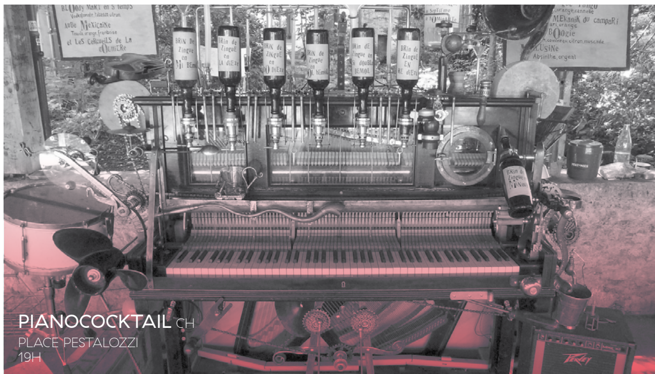
PIANOCOCKTAIL CH PLACE PESTALOZZI 19H

Le pianococktail est un piano arrangé de quelques alcools et entonnoirs. Mais c'est un bar avant toute chose. Pour que le pianiste joue, il faut que les gens boivent. Le piano se charge du reste. Chaque cocktail – avec ou sans alcool – a sa propre musique. On fait son choix puis on passe commande au pianiste. Ses musiques dérivent, grincent et se déglissent comme l'ivresse d'une fin de nuit.